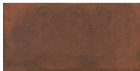
MMXU ロツソ 495x995