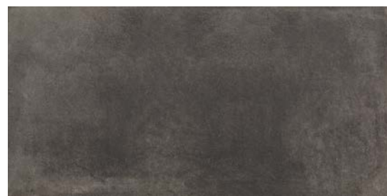
MMXT グリージオ スクーロ 495x995