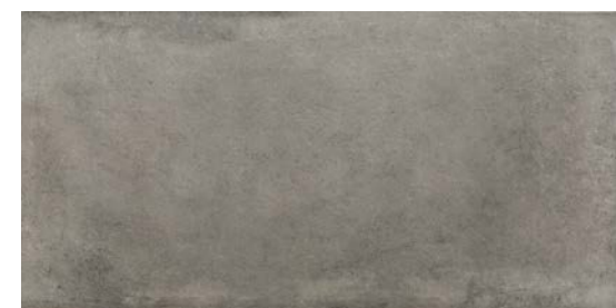
MMXS グリージオ キアーロ 495x995