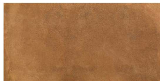
MMXR オクラ 495x995