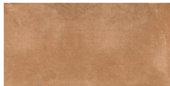
MMXV ローザ 495x995