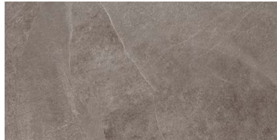
M06V チェネレ 495x995