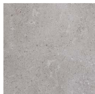
MM53 グリージオ 598x598