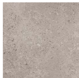
MLF2 タウベ 598x598