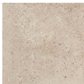
MHE1 ページュ 598x598