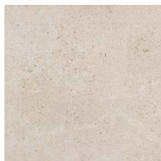
MLD5 ピアンコ 598x598