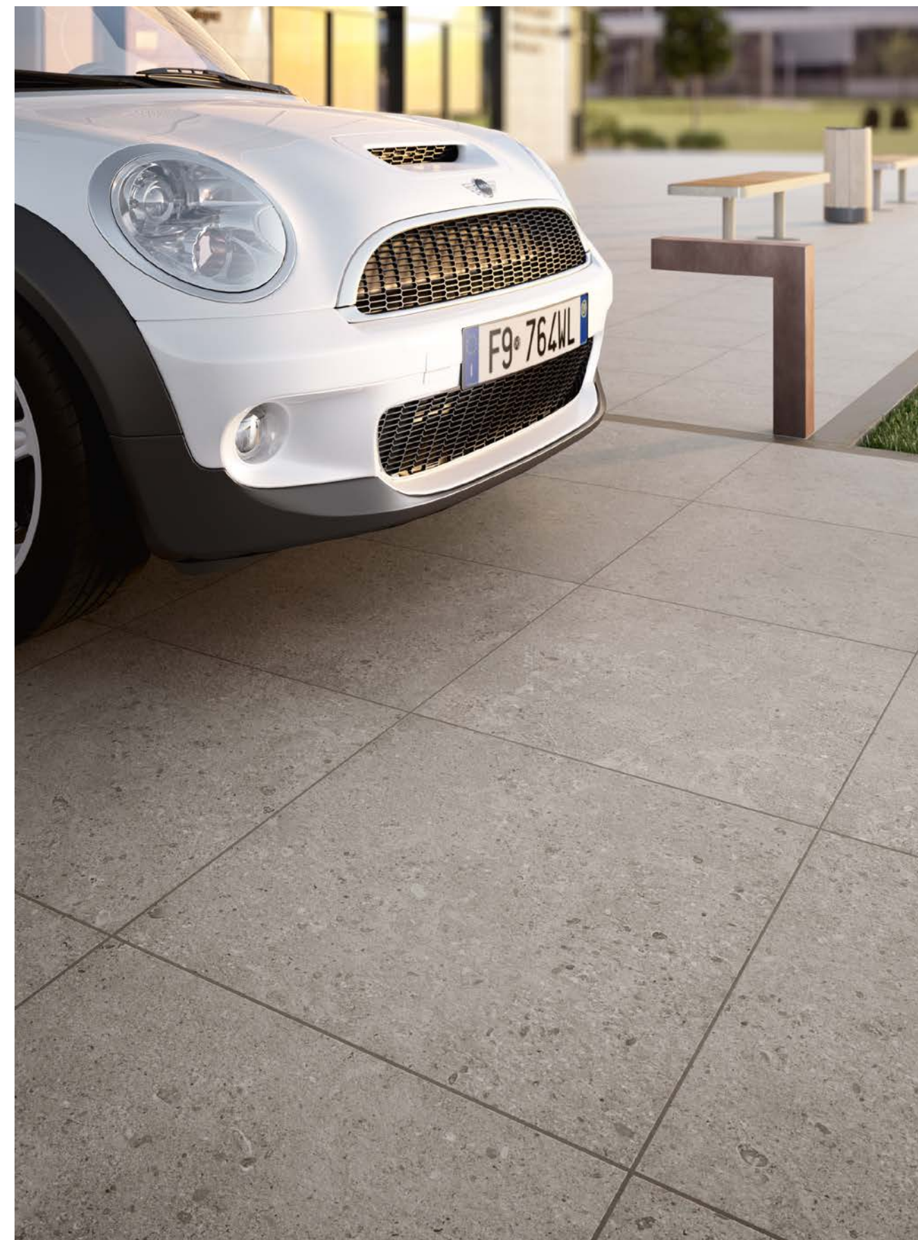
MM53 マイストーン gris フルーリー20 グリージオ 598x598