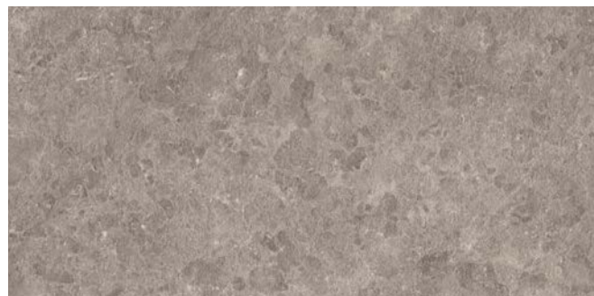
M872 タウベ 598x1198