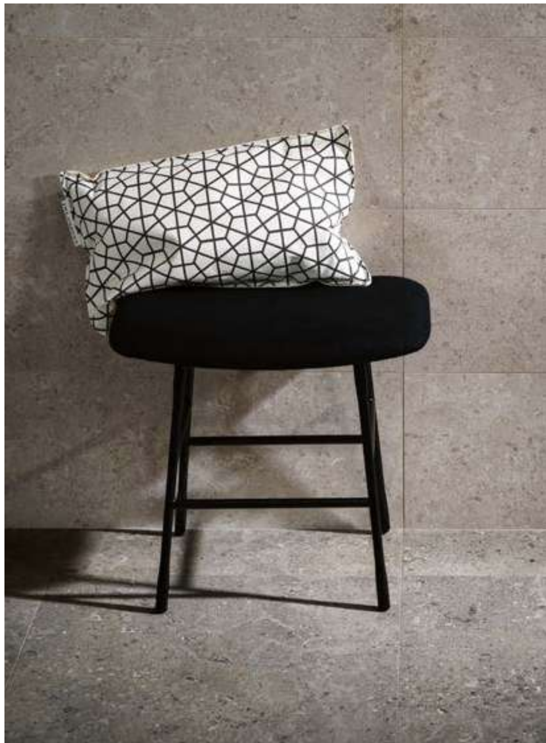
MLH4 タウペマット 298x1198 MLGY タウペマット 598x1198