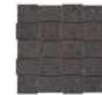
MLWF モザイク 298x298 (1)

サイズ • Formati • Sizes • Formats • Formate • Formatos