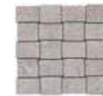
MLWE モザイク 298x298 (1)