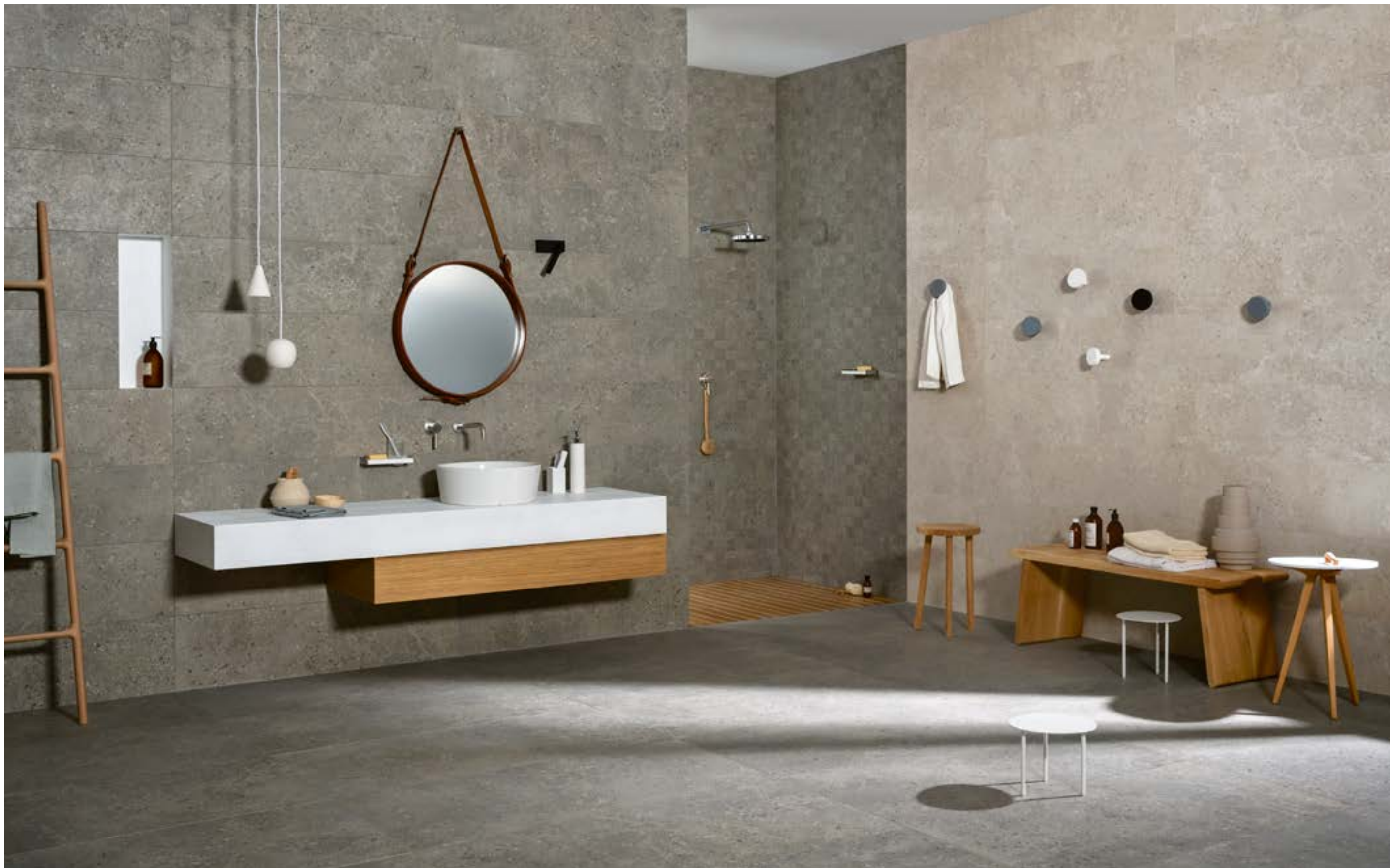
MLH4 タウペ マット 298x1198 MLGY タウペ マット 598x1198