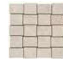
MLWA モザイク 298x298 (1)