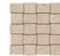
MLWD モザイク 298x298 (1)