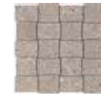
MLWC モザイク 298x298 (1)