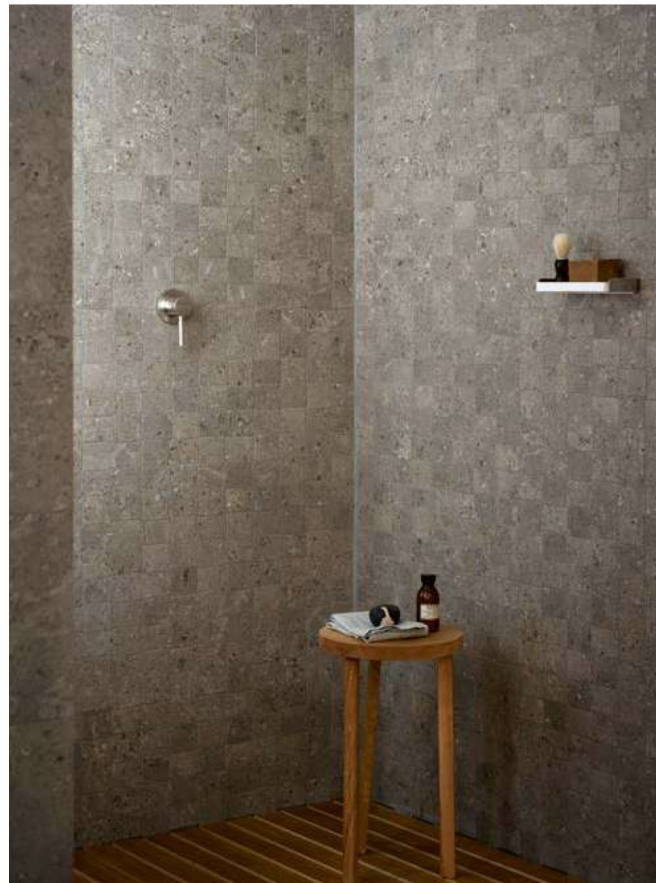
MLH4 タウペマット 298x1198 MLWC モザイコタウペ 298x298