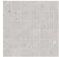
M8JY モザイク ホワイト 298x298 (2)