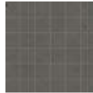
M8KO モザイク アントラチッテ 298x298 (2)