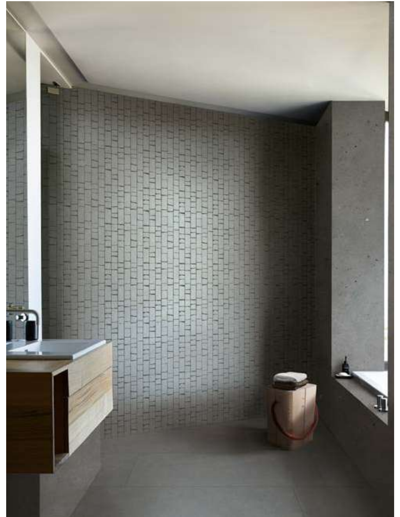
M8LL モザイク アントラチッテ 石割調 298x298 M6AZ アントラチッテ マット 898x898