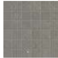
M8JZ モザイク グレイ 298x298 (2)