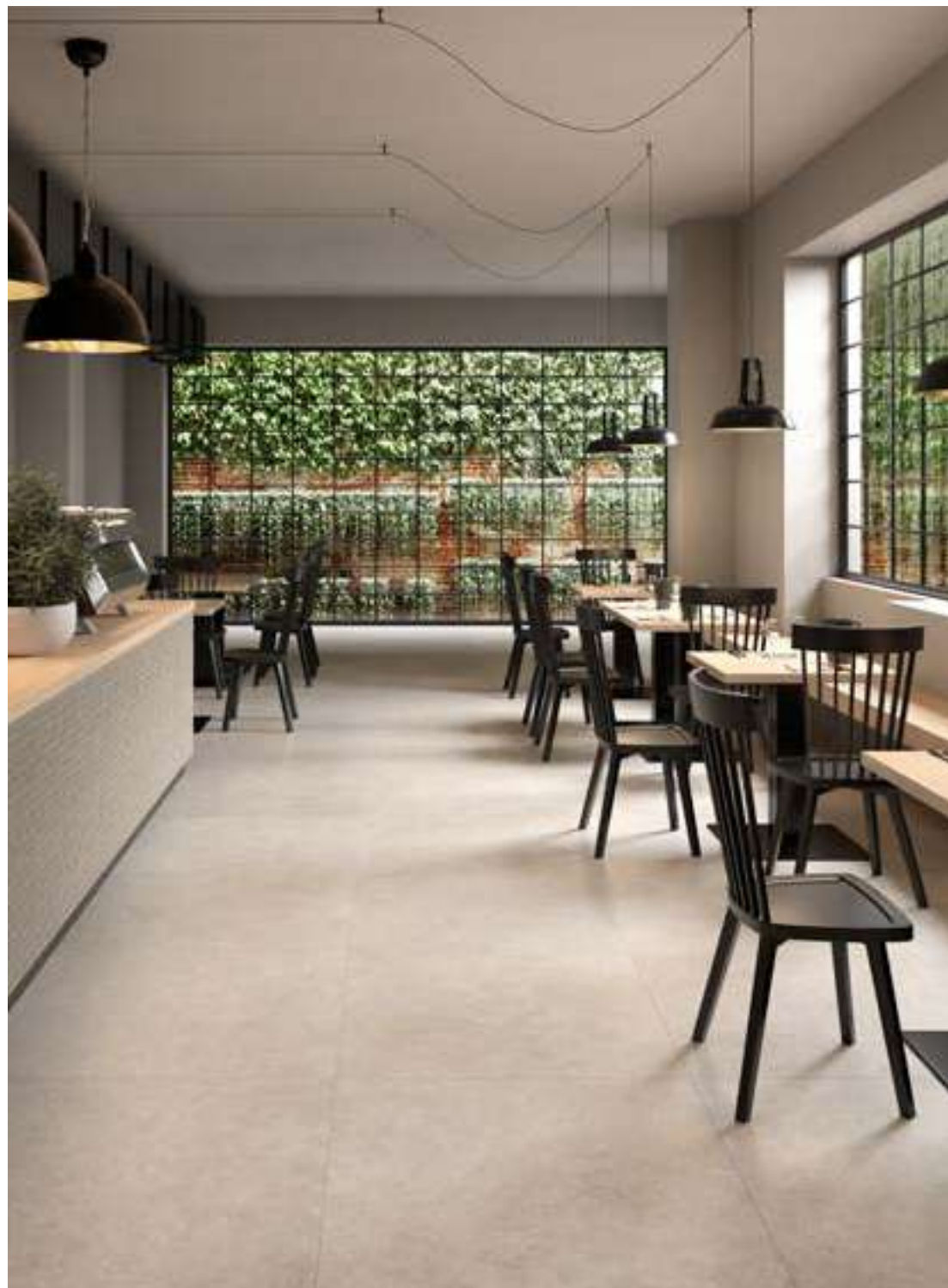
M8LJ モザイクホワイト 石割調 298x298 M6DS ホワイト マット 898x898