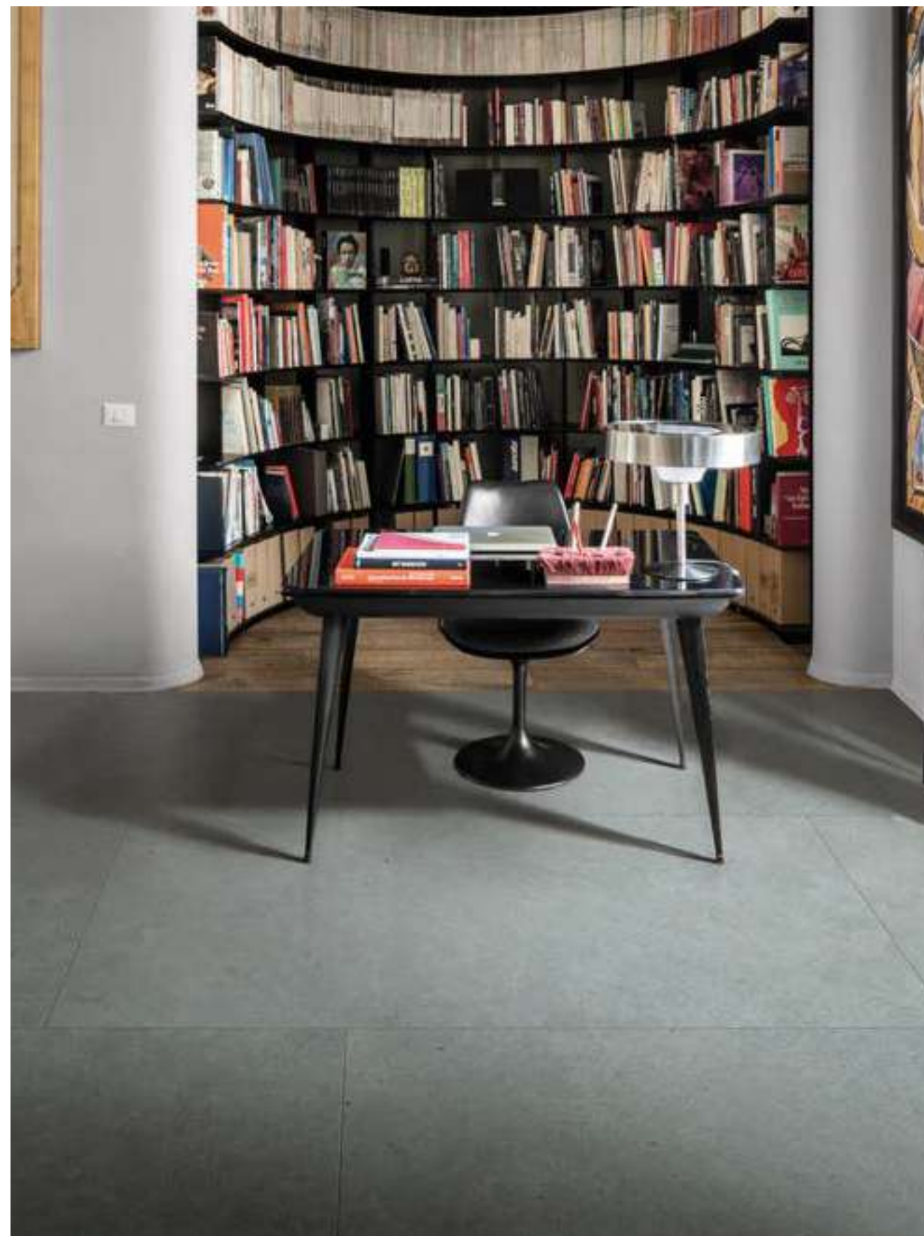
M6AS アントラチッテ マット 898x1798 M7C0 ヴェーロロヴェレ マット 198x1198