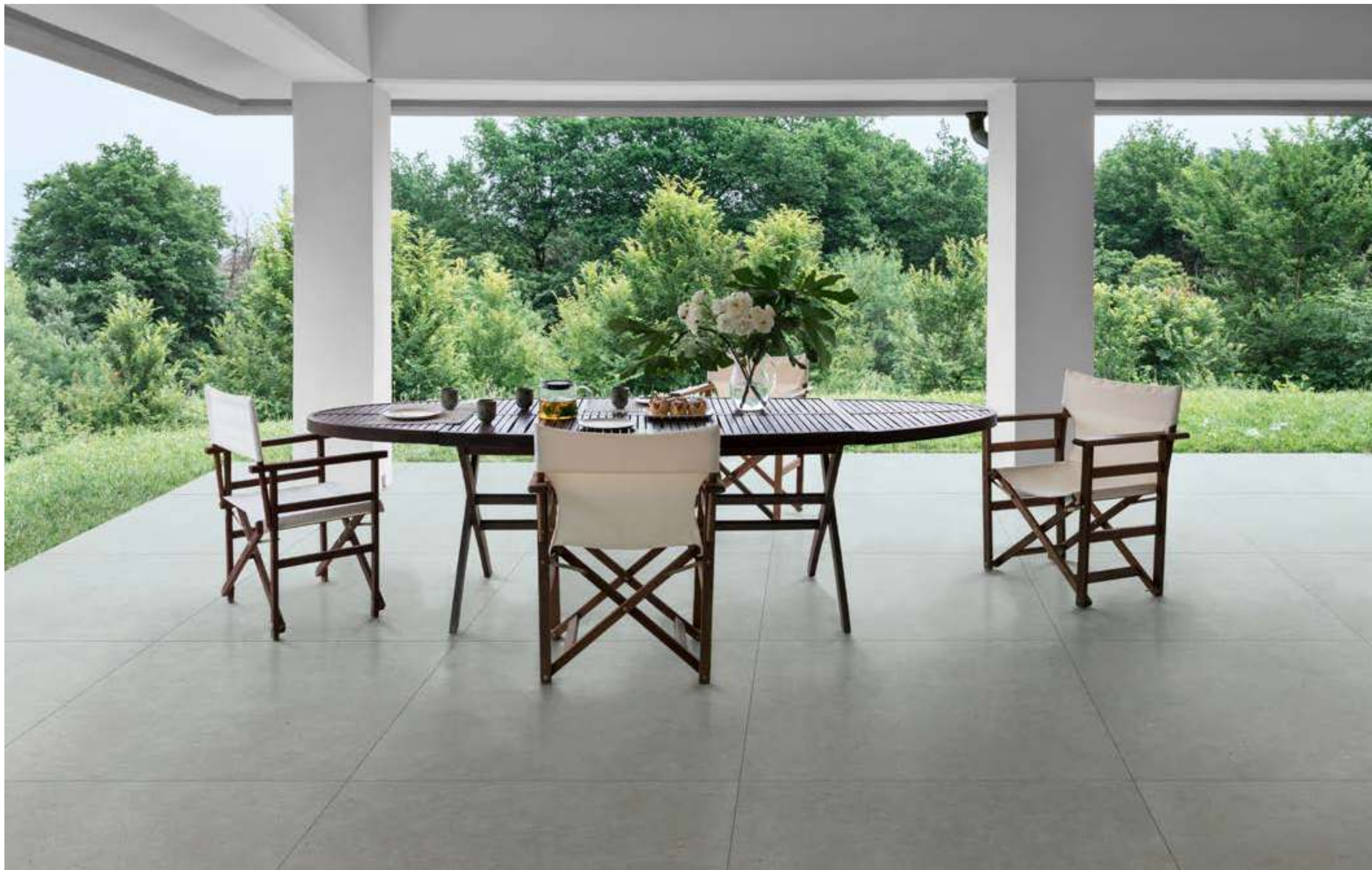
M6AX ホワイト マット 898x1798