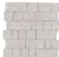
M8LJ モザイク ホワイト 石割調 298x298 (1)