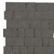
M8LL モザイク アントラチッテ 石割調 298x298 (1)