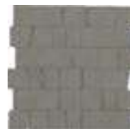
M8LK モザイク グレイ 石割調 298x298 (1)