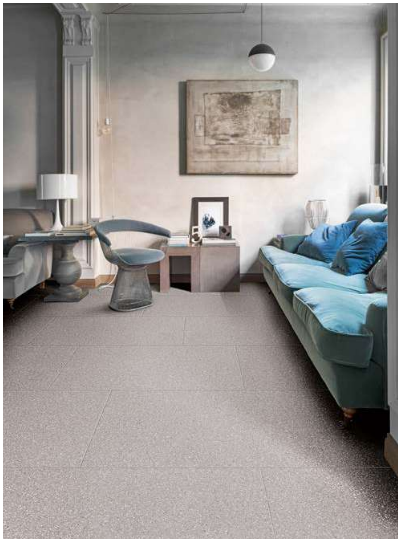
M8DT ライトグレイ マット 598x1198