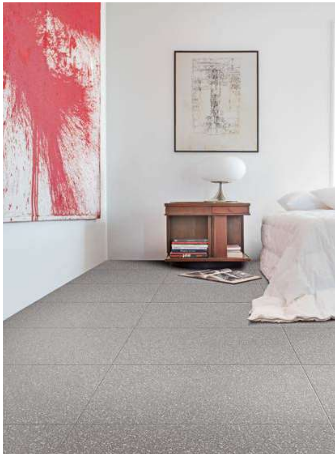
M8E9 ダークグレイ マット 598x598