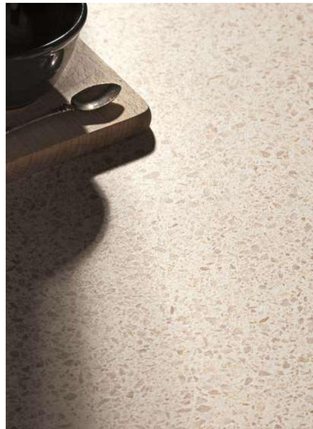
M8E7 ベージュ マット 598x598