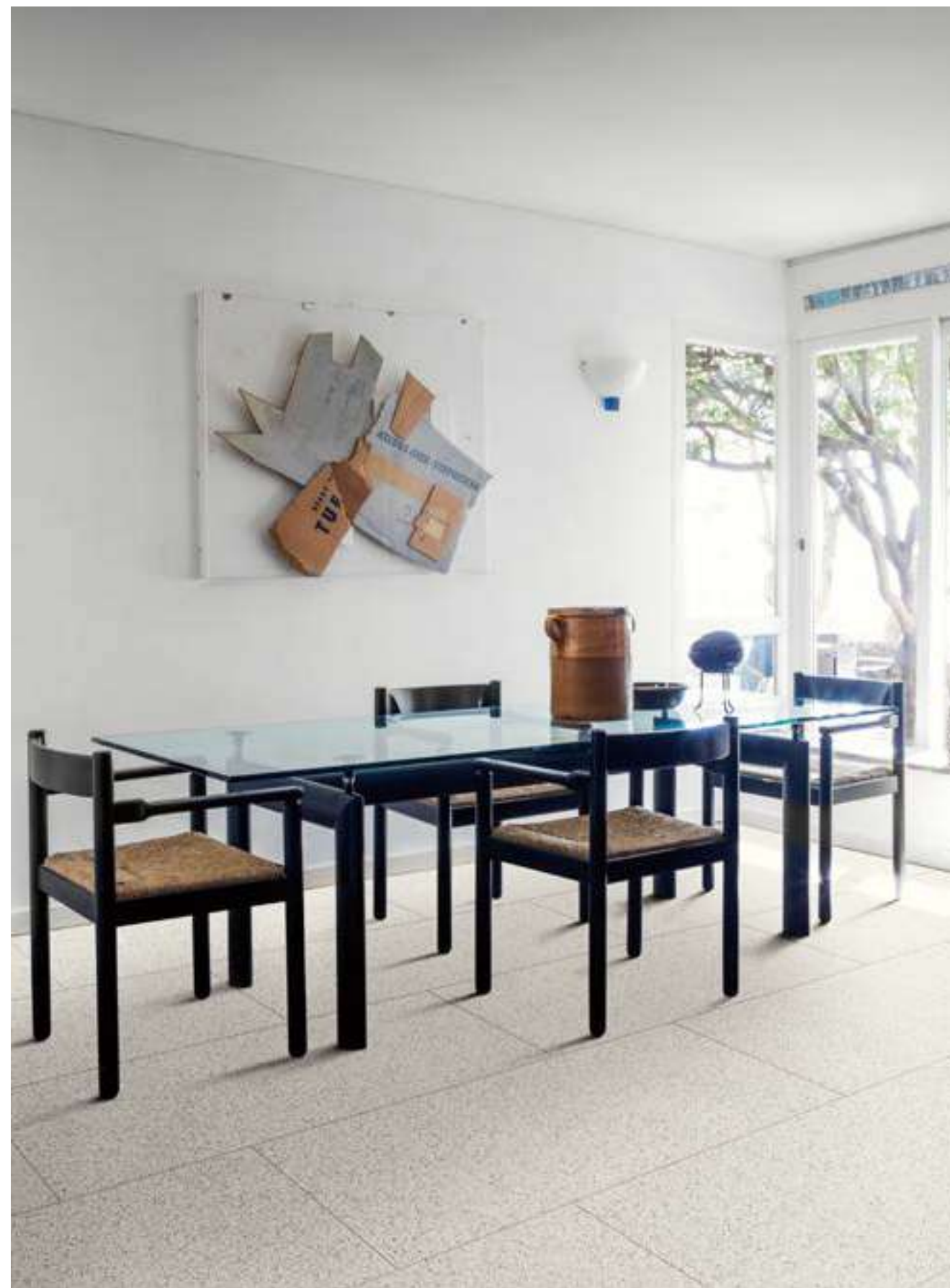
M8DR ホワイト マット 598x1198