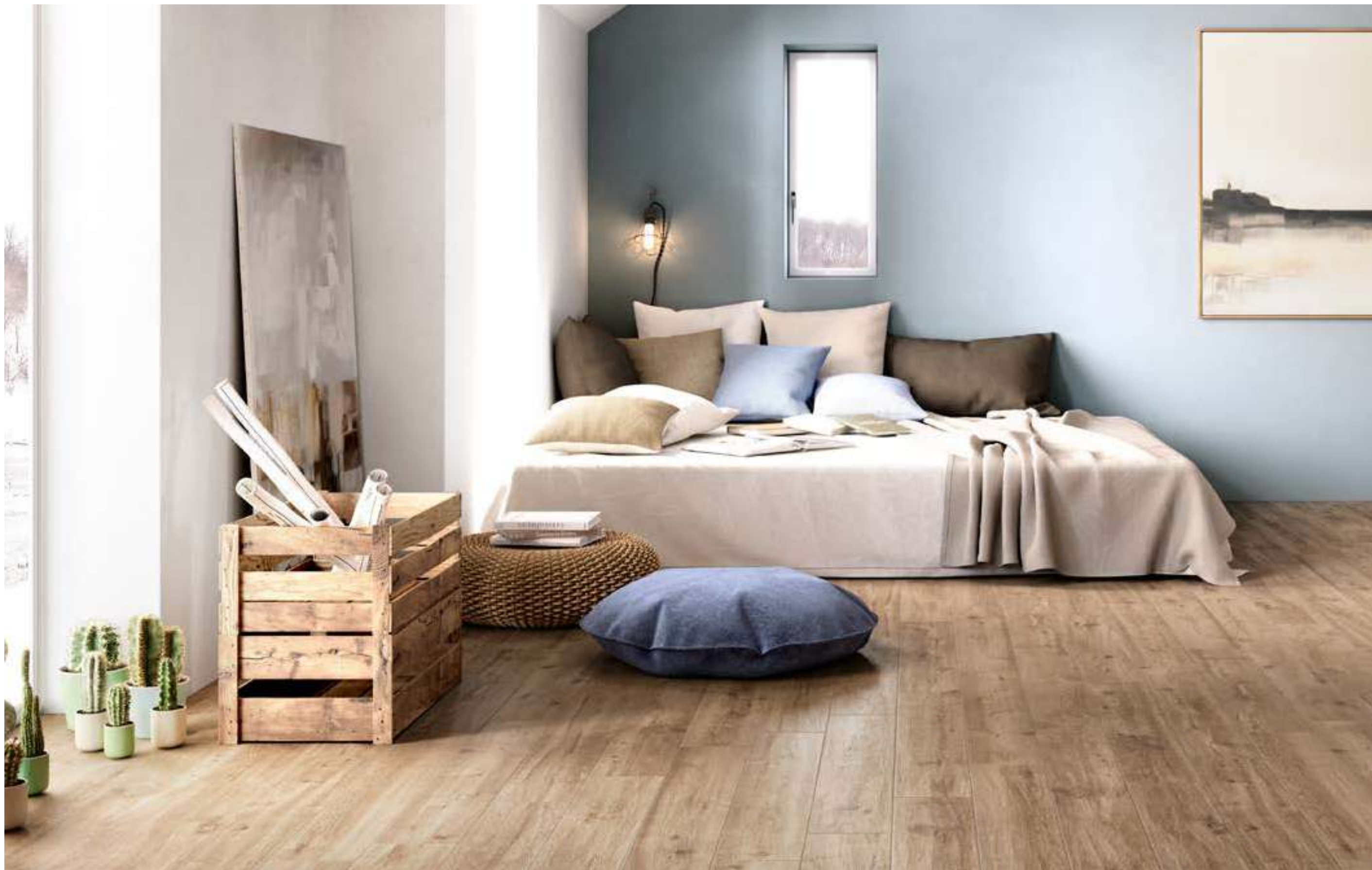
MLA2 ロヴェレ マット 150x900