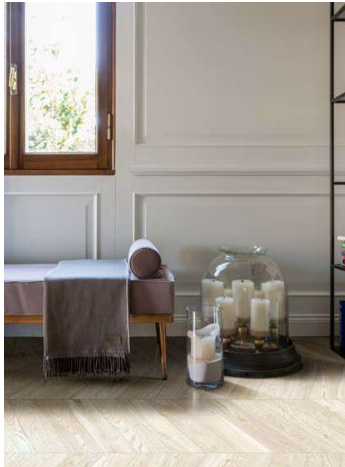
MDYG ベットウーラシェブロン 110x540