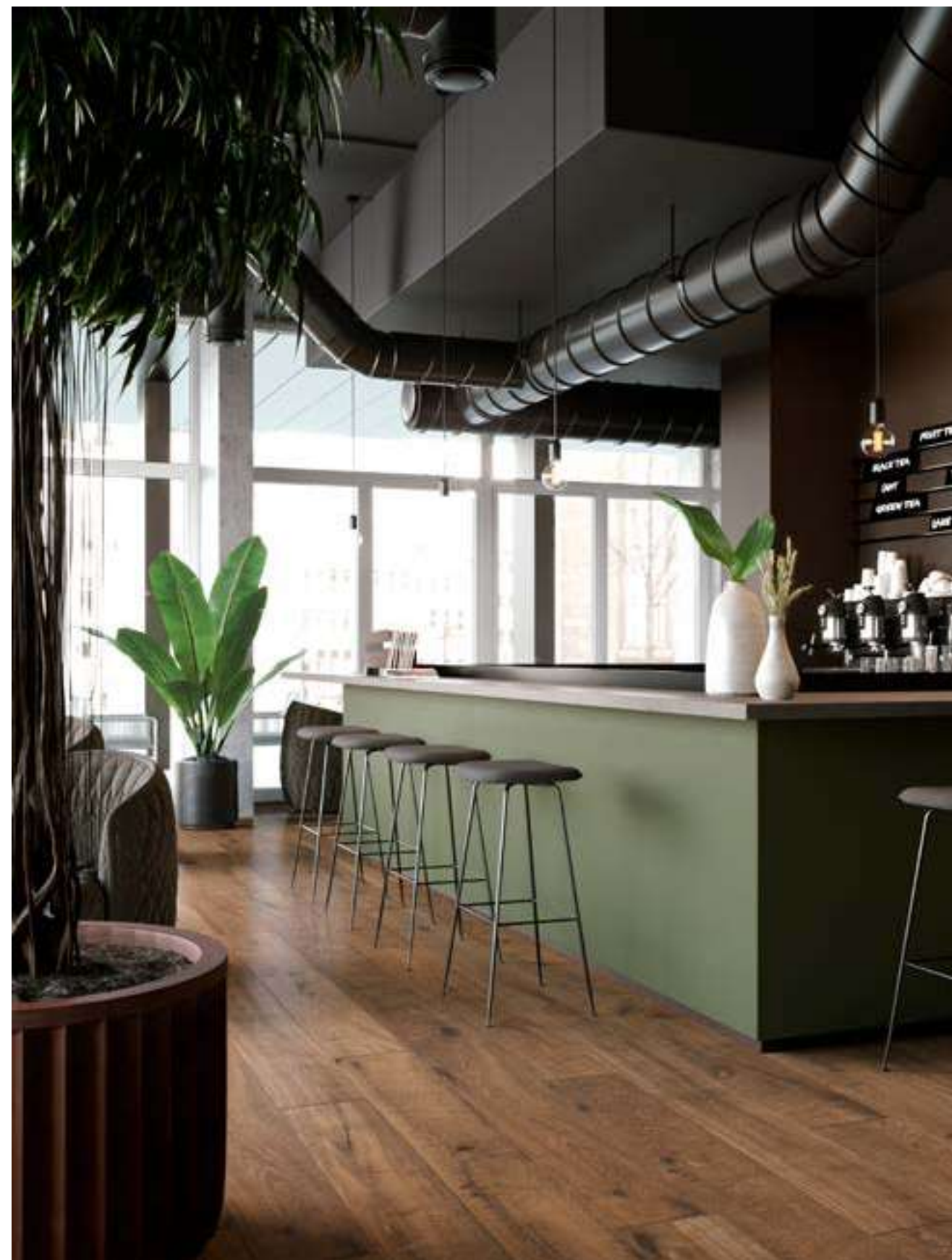
M7AV カスターニョ マット 223x1798