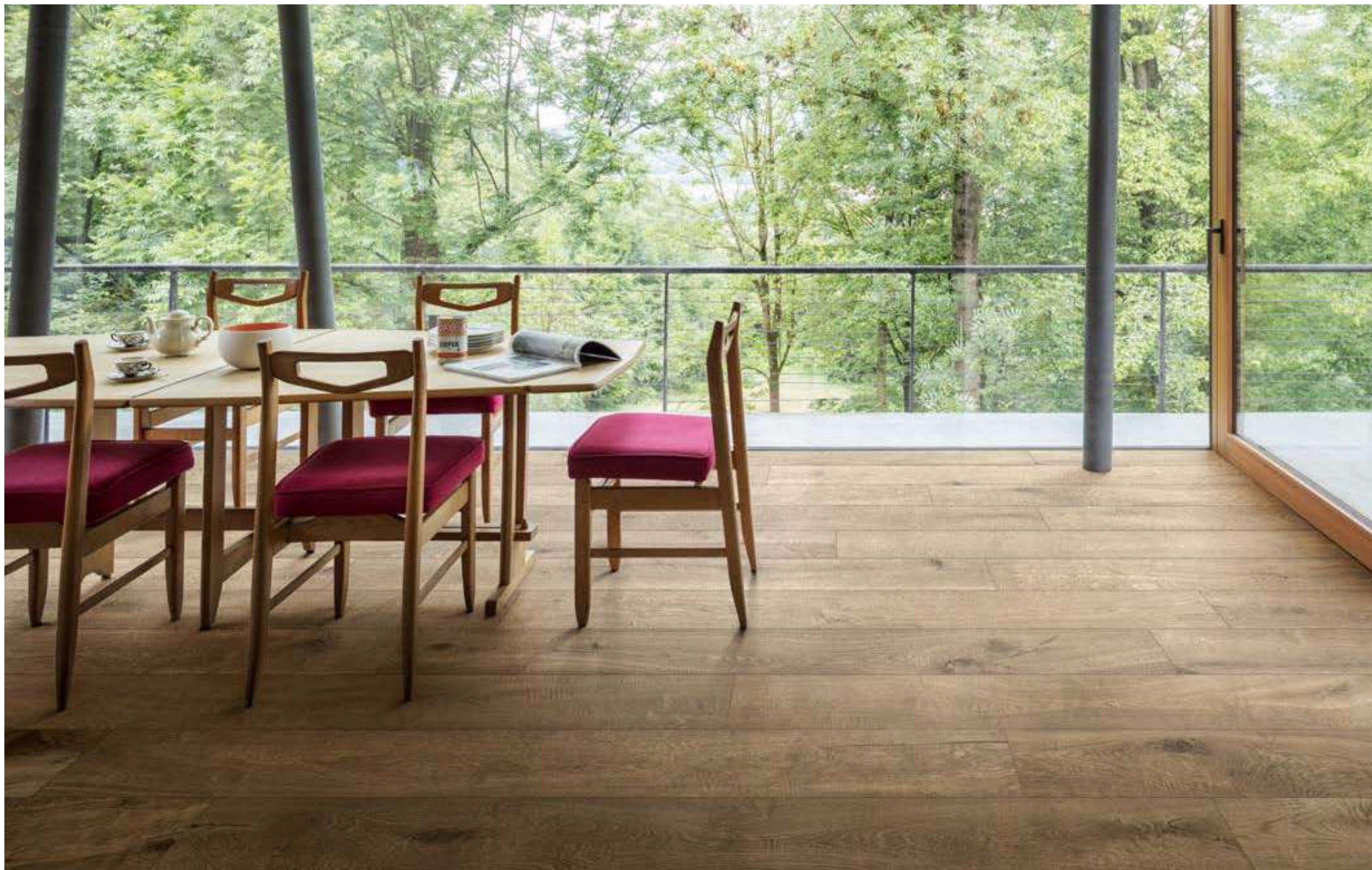
M7AS ロヴェレ マット 223x1798