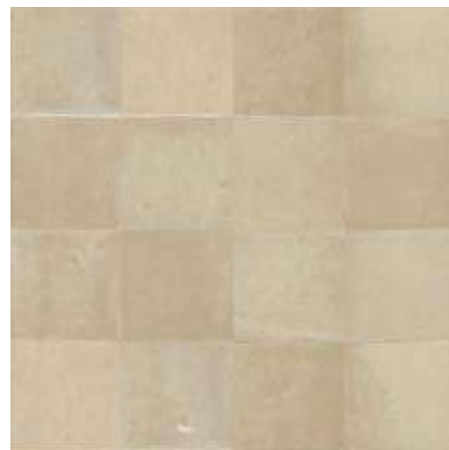
M5QA ラーナ 100×100