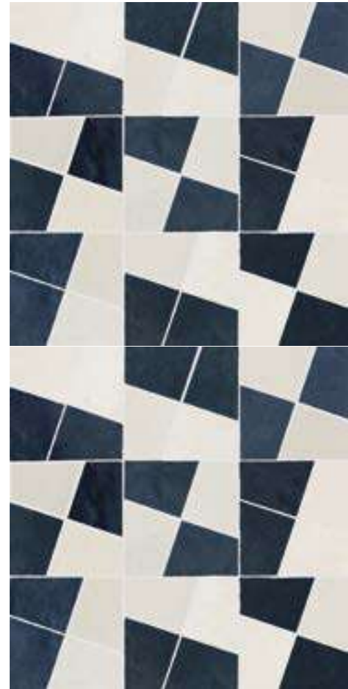
M8WG モザイク ジェッソ/チャイナ 298x298*