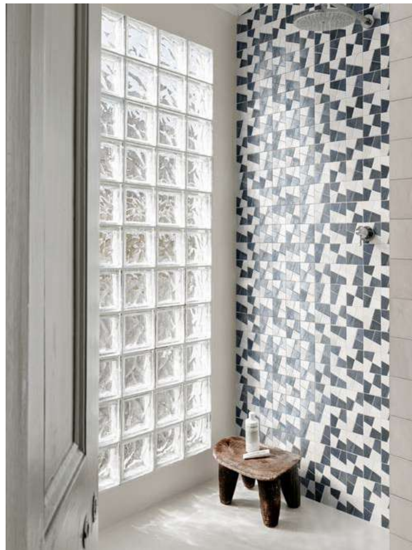
M5S0 ゼリージェ ジェツソ 100x100 M8WG ゼリージェ モザイコ ジェツソ/チャイナ 298x298