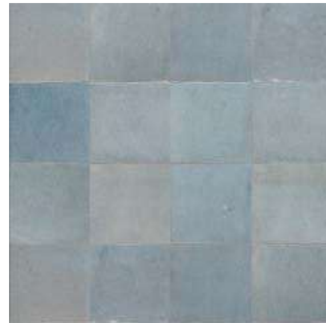
M5P5 シエロ 100x100