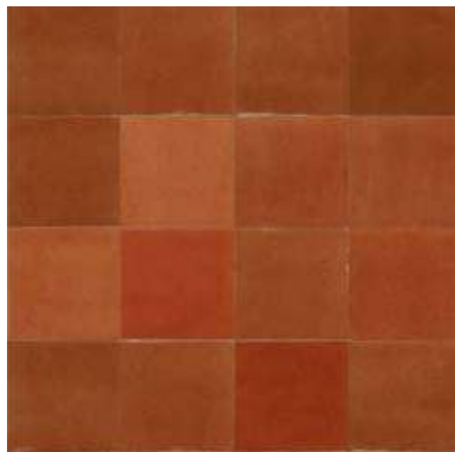
M5RS コラルロ 100×100