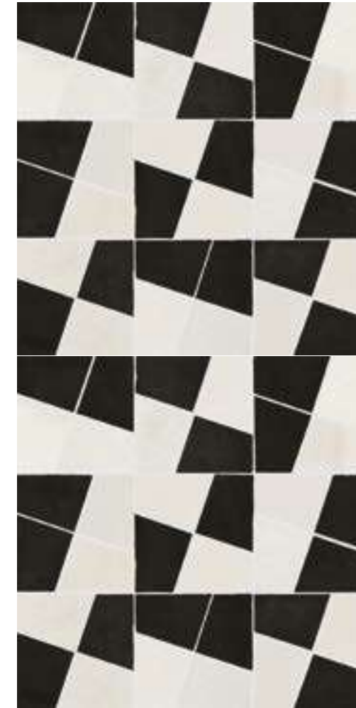
M8WH モザイク ジェッソ/カルボナーネ 298x298*

* 300x300モザイクは受注生産となります • La produzione di Mosaico Zellige è su richiesta • Mosaico Zellige is produced to order • La production de Mosaico Zellige se fait à la demande • Die Herstellung von Mosaico Zellige erfolgt auf Anfrage • La producción del Mosaico Zellige se realiza bajo pedido.