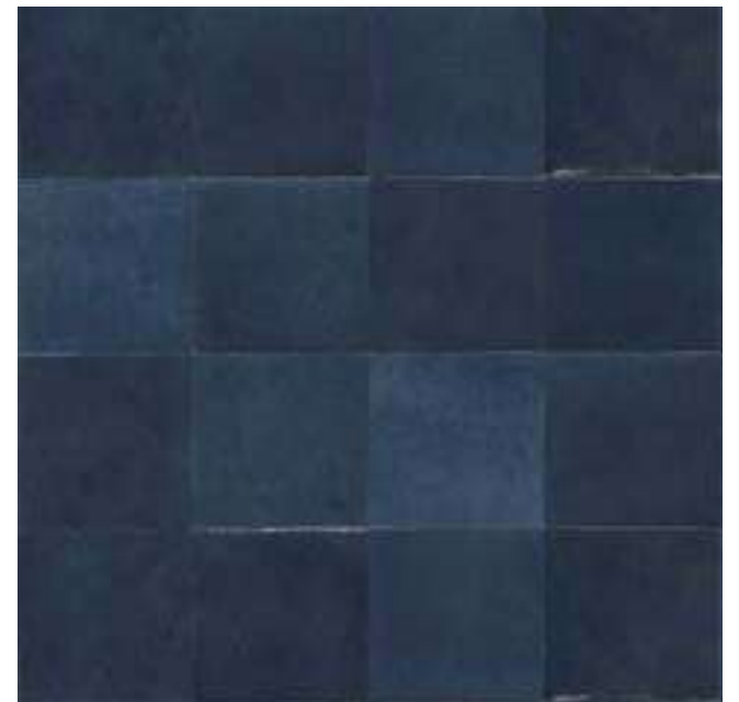
M5PS チャイナ 100x100