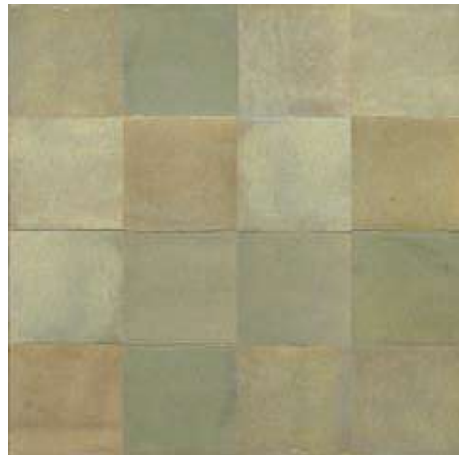
M5P3 サルヴィア 100x100