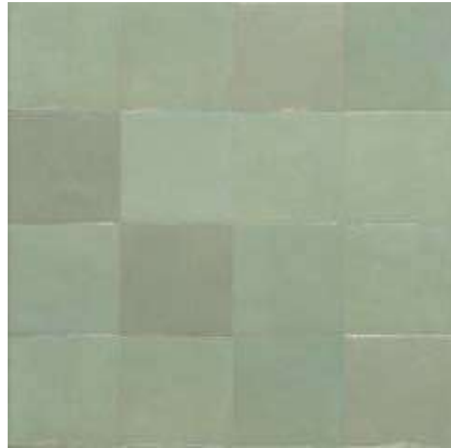
M5P4 トゥルケーゼ 100x100