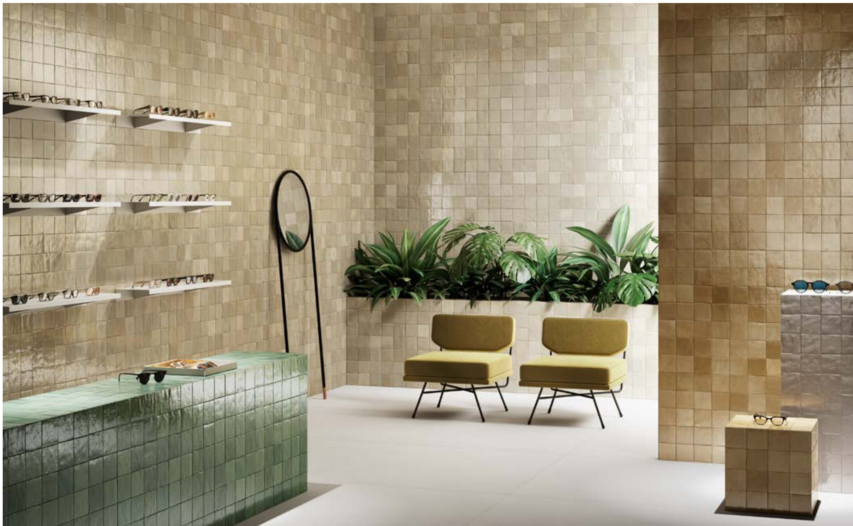
M5QA ゼリージェ ラーナ 100×100 M5P4 ゼリージェ トウルケーゼ 100×100 M5P2 ゼリージェ カメロ 100×100