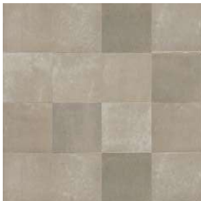
M5QC アルジッラ 100×100