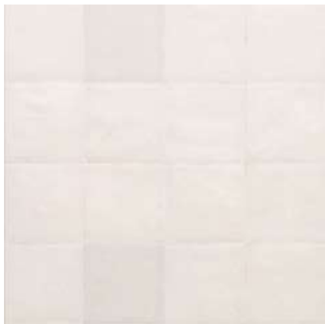
M5S0 ジェツソ 100×100