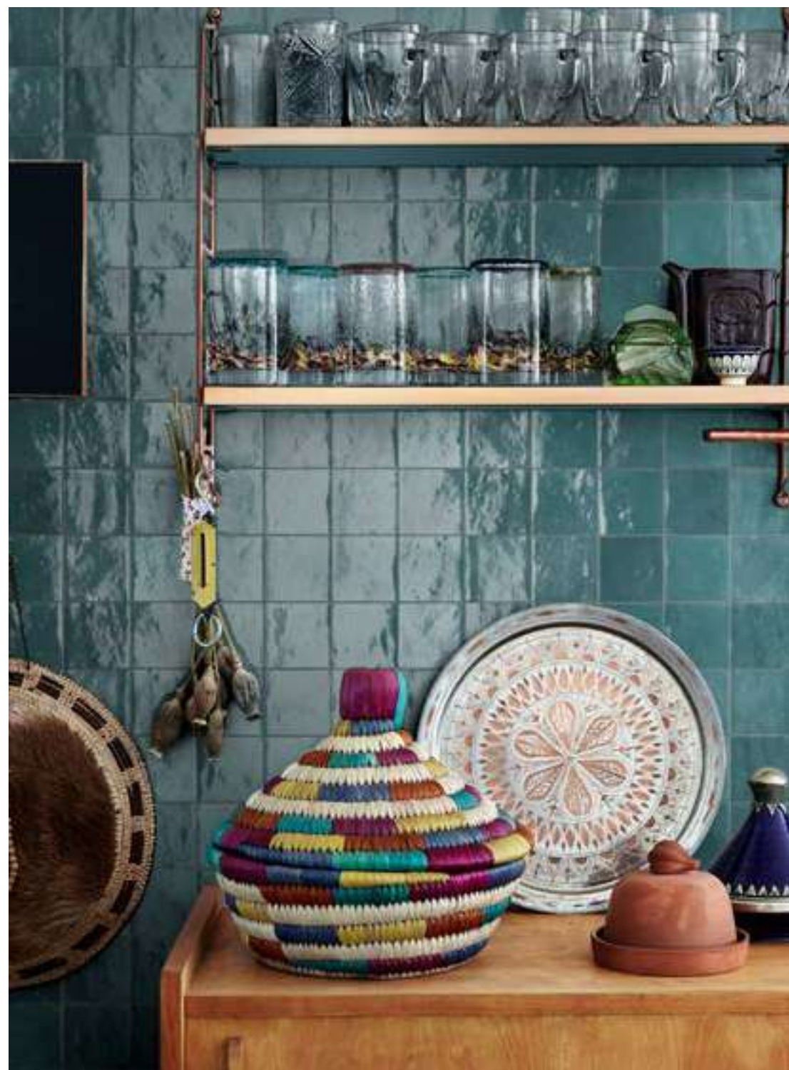
M5P6 ゼリージェ ペトローリオ 100x100