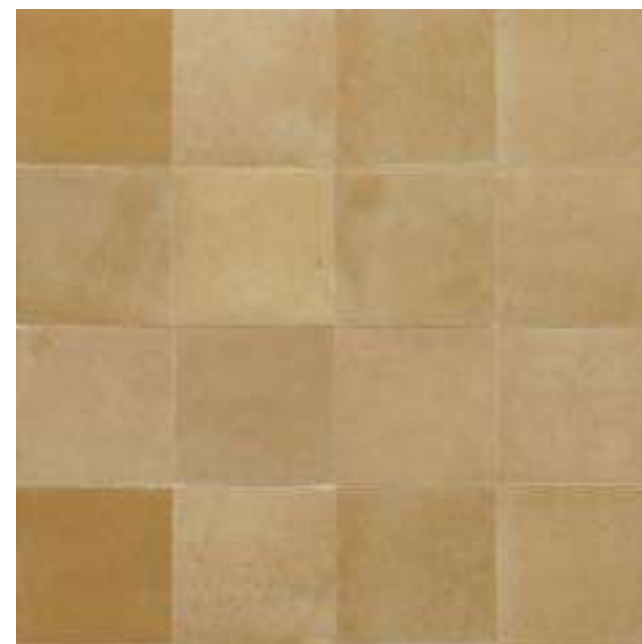
M5P2 カメロ 100×100