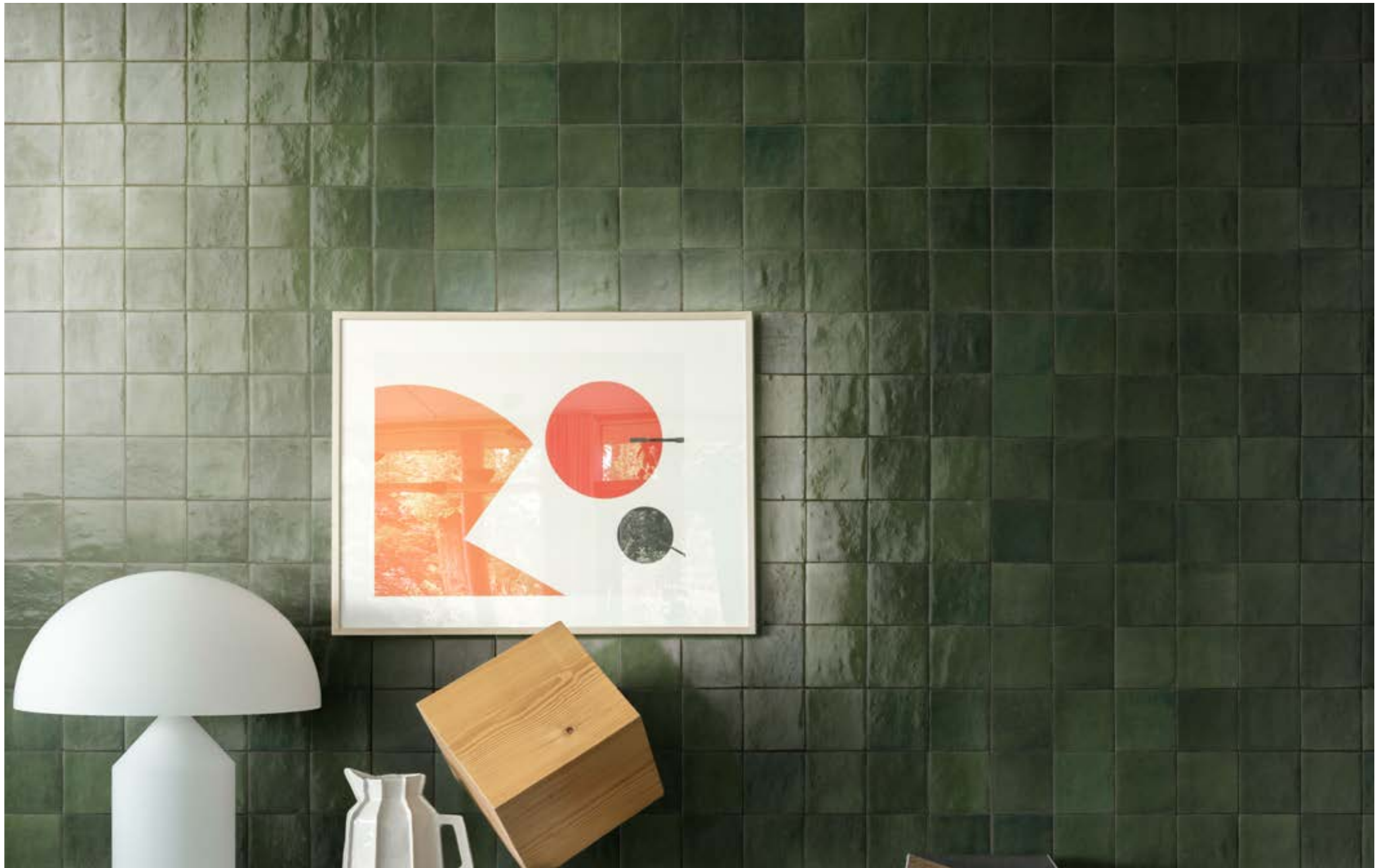
M5QS ゼリージェ ボスコ 100×100