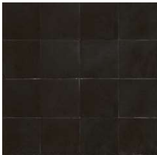
M5S1 カルボーネ 100×100