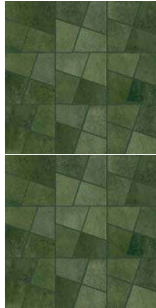
M8WF モザイク ボスコ 298x298*