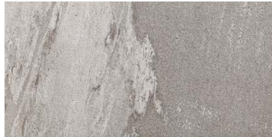
MMXP グレイージュ 495x995 H