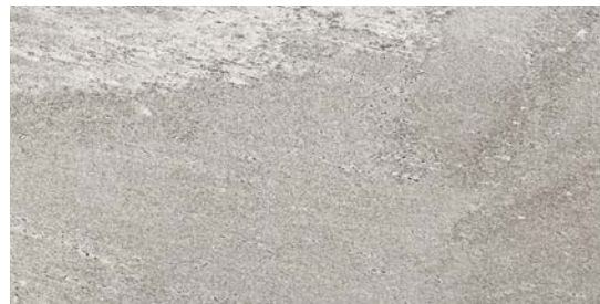
MMXN グレイージュ 495x995 H