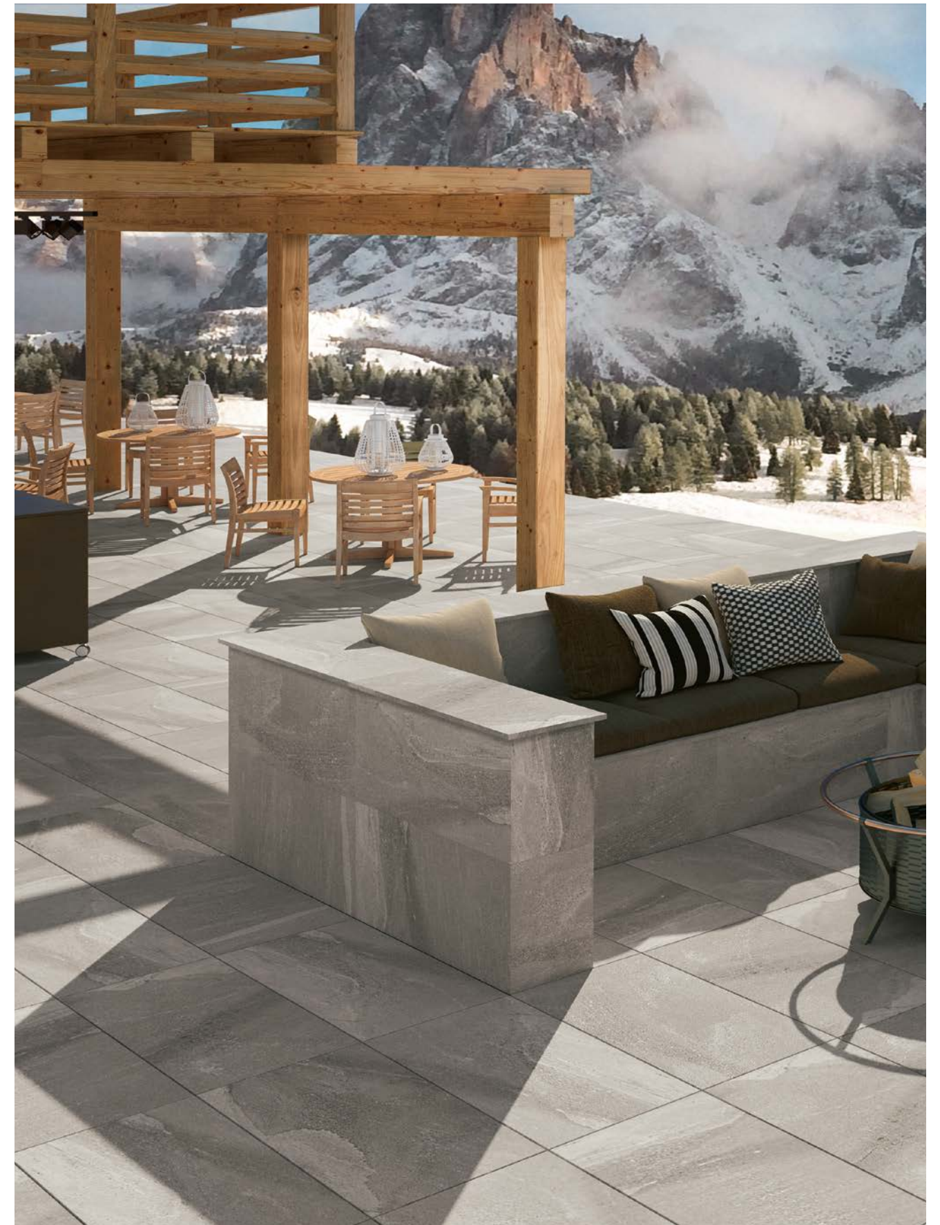
MMXN マイストーンベオラ20 グレイージュ 495x995