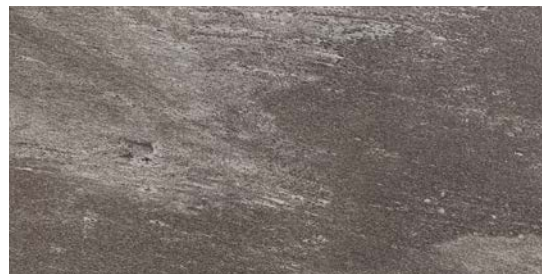
MMXQ アントラチッテ 495x995 H